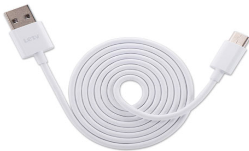
图 1 Type-c线

软件：FactoryTool-1.72.7 工具、DriverAssitant_v5.1.1 工具、相应版本的 RK 系列板卡固件。