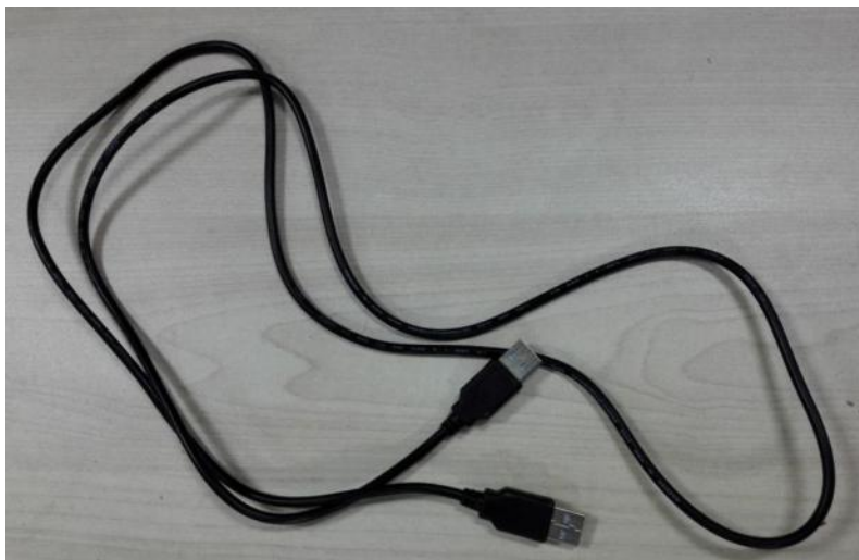
图 1 双头 USB 线

软件： FactoryTool_v1.52 工具、 DriverAssitant_v4.5 工具、 相应版本的 RK 系列板卡固件。